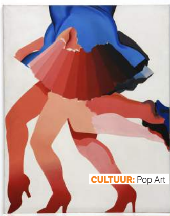
CULTUUR: Pop Art