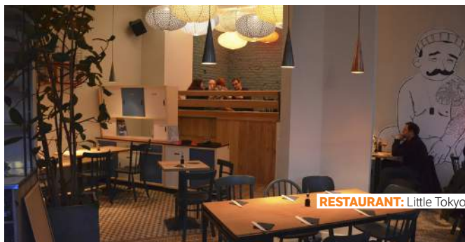
RESTAURANT: Little Tokyo