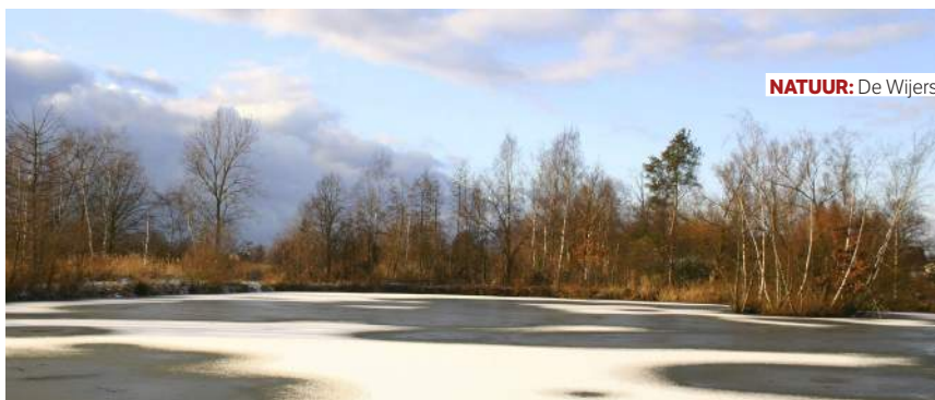
NATUUR: De Wijers