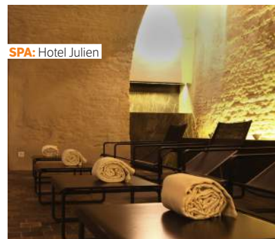
SPA: Hotel Julien